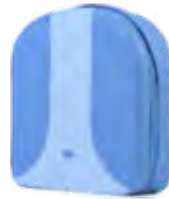
Bolsa para el kit ES