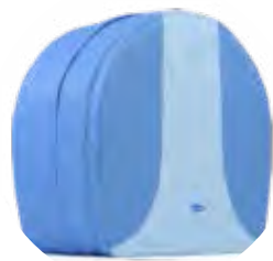
Bolsa para el kit MD

A solicitud del cliente es posible combinar el dispositivo con los aplicadores Biotecna® según las necesidades individuales de cada usuario. Biotecna® ofrece el surtido de aplicadores más amplio en el mercado. Los asesores de la empresa Biotecna® o de compañías asociadas autorizadas le recomendarán la mejor combinación del dispositivo y aplicadores (kit) para indicaciones médicas concretas.