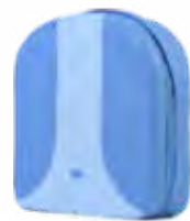
Bolsa para el kit FS