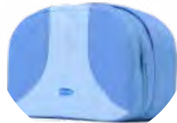
Bolsa para el kit FR