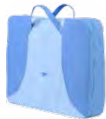
Bolsa para el kit NT